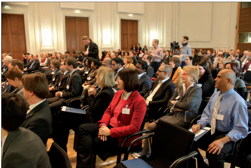
Über 200 Teilnehmer/innen verfolgen aufmerksam die Preisverleihung an Unternehmen mit herausragender Willkommenskultur.